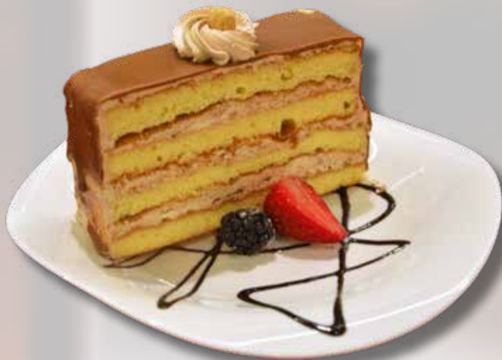
Nußschnitte Torta alle noci € 5.10