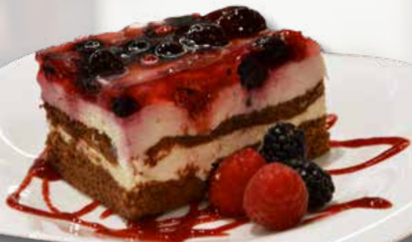
Joghurtschnitte Torta allo yoghurt € 5.10