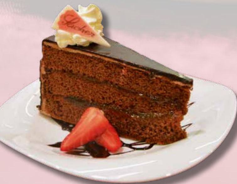
Sachertorte Torta Sacher € 5.10

Schauen Sie in unsere Vitrinen, wir verfügen über eine reiche Auswahl an Kuchen!