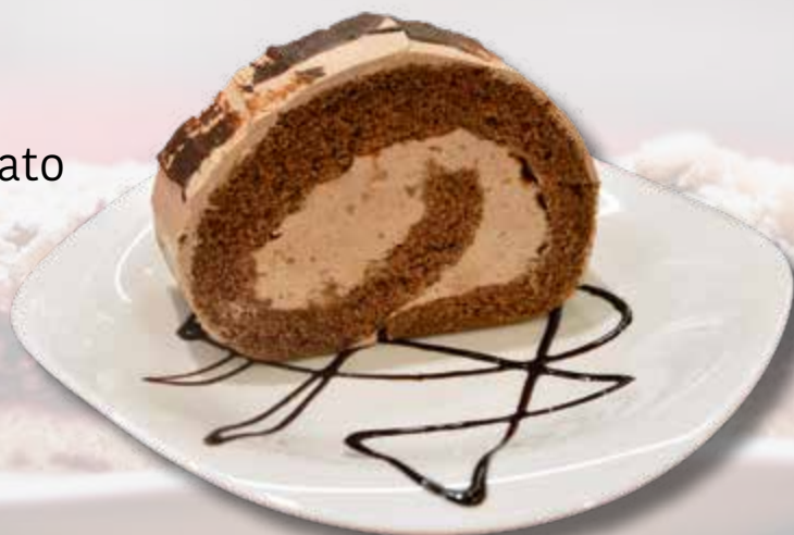
Schokoroulade Rotolo al cioccolato € 5.10